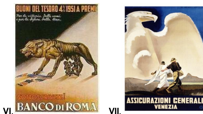
Figura VI: Cartaz de propaganda com a Loba do mito da fundação de Roma. Figura VII: Águia Romana, símbolo do império em cartaz de propaganda.

“Os ideais fascistas, eram inculcados, primeiramente, nos jovens, pois considera-se que as crianças, antes de pertencerem às famílias, pertenciam ao Estado. Na Itália, a partir dos 4 anos, as crianças ingressavam nos ‘Filhos da Loba’ e usavam já uniforme; dos 8 aos 14 faziam parte dos ‘balillas’, aos 14 eram vanguardistas e aos 18 entravam nas Juventudes Fascistas”