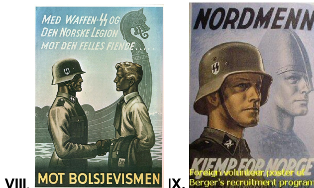
VIII. Cartaz de propaganda nazista dos países Escandinavos, ao fundo da imagem vê-se um barco típico dos antigos Vikings. IX. Cartaz de propaganda nazista, soldado alemão e guerreiro nórdico aparecem como um só.

Os integrantes do corpo armado do partido nazista, as temíveis SS, entraram em combate nos campos de guerra com bravura e dedicação dos antigos guerreiros da mitologia germânica, obedecendo fanaticamente às ordens mais insanas de seus superiores. Entre os oficiais do exército alemão, a taxa de suicídio era muito elevada, essa prática nos meios militares demonstrava o desejo de morrer como os antigos guerreiros do folclore nórdico. Essa “militarização” da mitologia teria garantido o renascimento dos mitos germânicos no decorrer do século XIX e XX, provocando sentimentos individuais e coletivos que tem todas as características do sagrado .